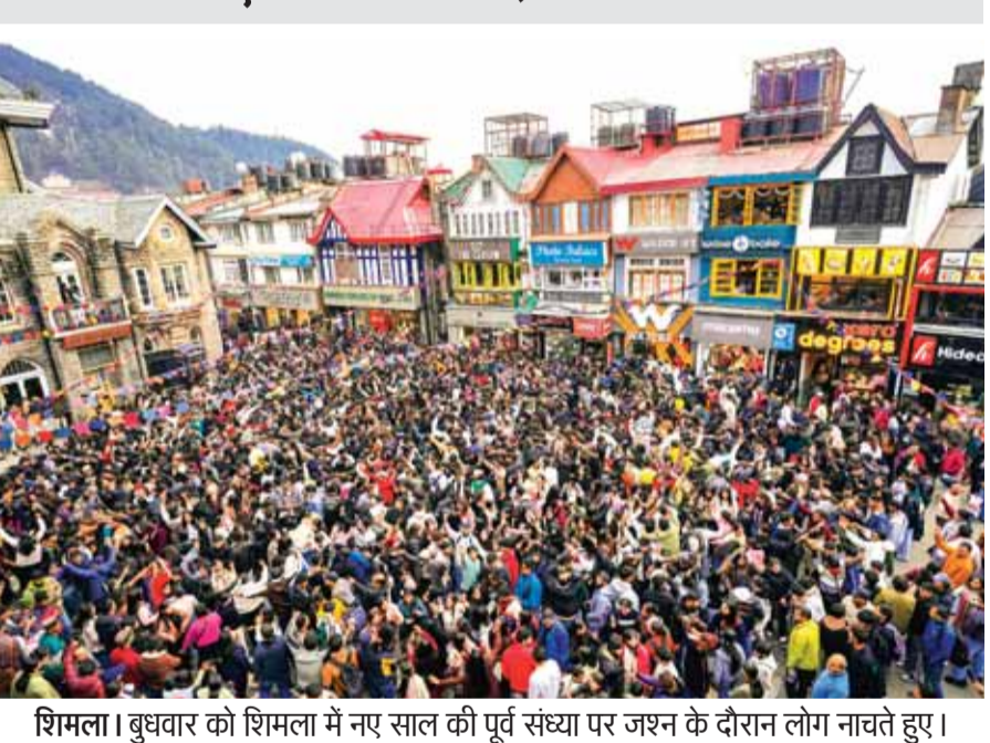
शिमला। बुधवार को शिमला में नए साल की पूर्व संध्या पर जश्न के दौरान लोग नाचते हुए।