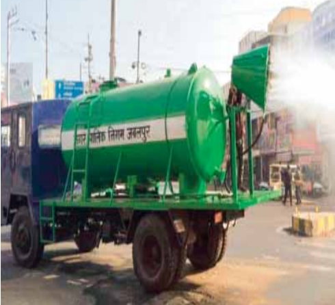
जबलपुर में फोगिंग मशीन शहर की हवा को लगातार स्वच्छ बना रही है। इससे शहर का एक्वआई मॉडरेट स्तर पर बना रहता है

दोनों शहरों की सबसे बड़ी और निम्नी चूड़ी उपलब्धियों में दमोह/कोटा पराईओवर जबलपुर शहरीकरण के लिए हाइड्रॉलिक और ताम्र अडवर्क के बाद दूसरी बृहत्-आकार की जबलपुर के स्वच्छता को संरक्षित करने के लिए बनाया गया। पराईओवर से इस क्षेत्र में वातावरण में एक महत्वपूर्ण उपलब्धि मिला गया। पराईओवर से इस क्षेत्र में वातावरण में स्वच्छता को संरक्षित करने के लिए बनाया गया। पराईओवर से इस क्षेत्र में वातावरण में स्वच्छता को संरक्षित करने के लिए बनाया गया।