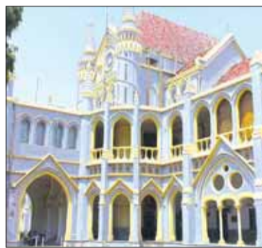
न्यायालय ने उसे आजीवन कारावास की सजा से दंडित किया है। बच्चा की देखभाल पीड़ित कर रही है और दोनों का देखरेख करने वाला कोई नहीं है। पीडिता को उसके परिवार ने छोड़ दिया है। कोर्ट ने