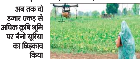
अब तक दो हजार एकड़ से अधिक कृषि भूमि पर नैनो यूरिया का छिड़काव किया

जहां स्कूटी की मनाही वहां ड्रोन उड़ाने लगीं महिलाएं