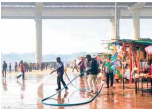
शहर सरकार नियमित रूप से सड़कों की धुलाई कराती है, जिससे धूल के कण खत्म होते हैं और शहरवासियों को साफ हवा मिलती है

इंदौर प्रदेश का सबसे बड़ा और स्वच्छतम शहर है लेकिन इसे देश के सबसे प्रदूषित शहरों में भी गिना जाता है। यहां औद्योगिकीकरण, बढ़ती आबादी, और वाहनों की संख्या में वृद्धि के कारण वायु प्रदूषण बढ़ रहा है। इंदौर में पीएम 2.5 और पीएम 10 (वायु में सूक्ष्म कण) की मात्रा अक्सर मानक से अधिक रहती है, जो श्वसन समस्याओं को बढ़ा सकती है।