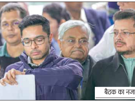
बैठक का नजारा

हिम्मत हो तो बैठक का सीसीटीवी फुटेज जारी करें