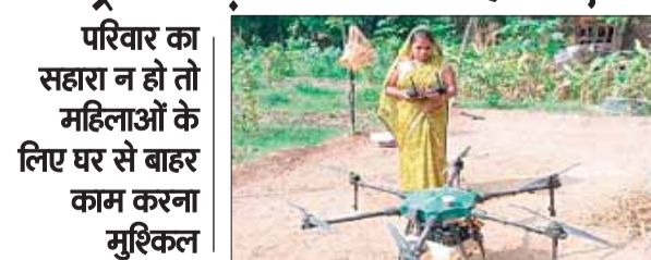
परिवार का सहारा न हो तो महिलाओं के लिए घर से बाहर काम करना मुश्किल